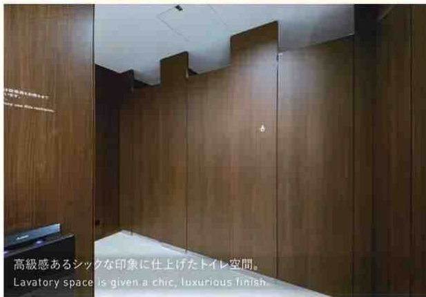
高級感あるシックな印象に仕上げたトイレ空間。 Lavatory space is given a chic, luxurious finish.