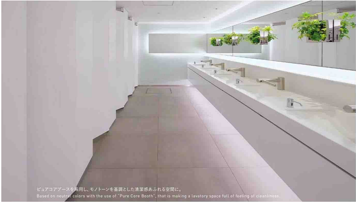
ピュアコアブースを採用し、モノトーンを基調とした清潔感あふれる空間に。 Based on neutral colors with the use of "Pure Core Booth", that is making a lavatory space full of feeling of cleanliness.