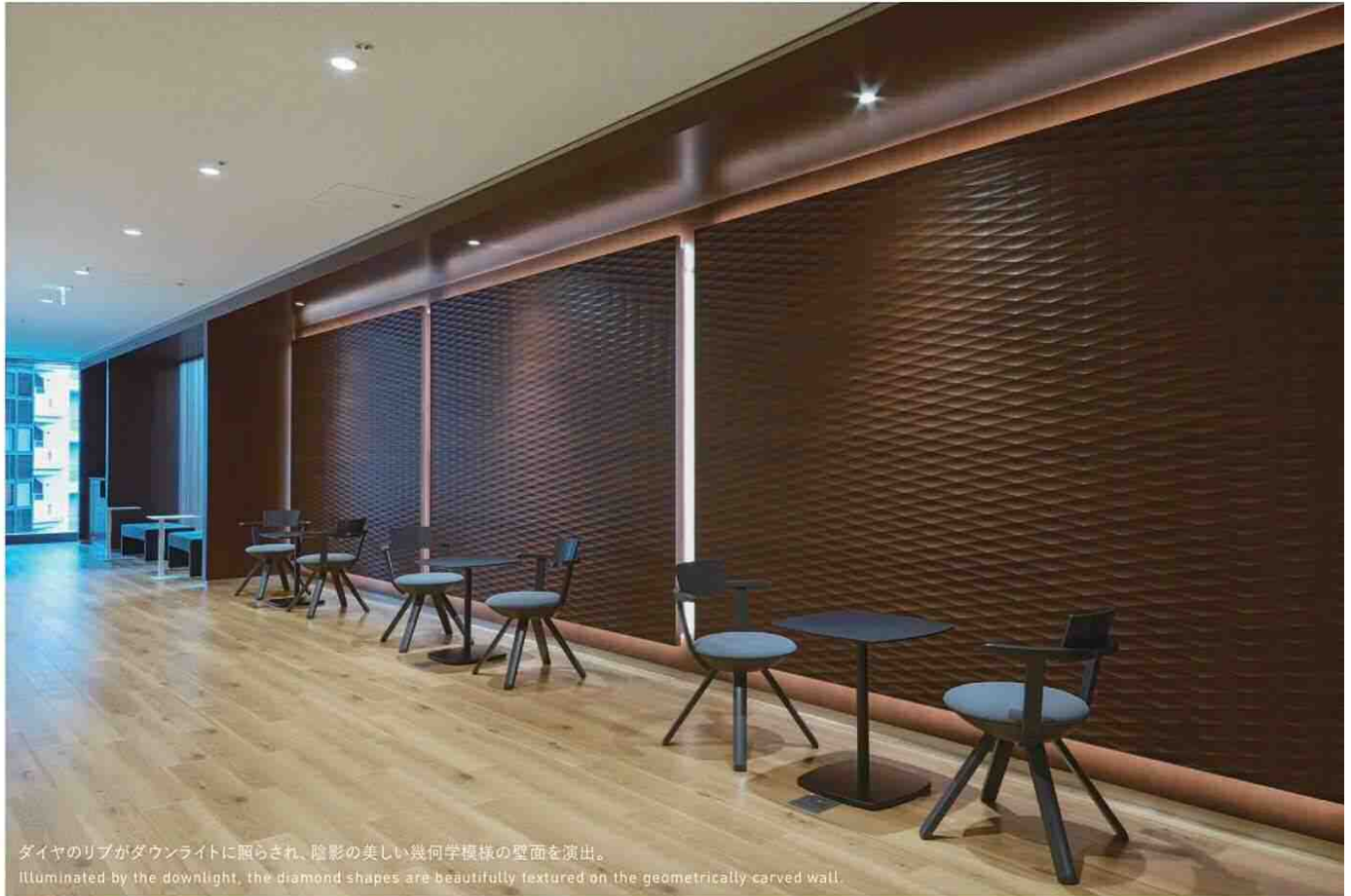
ダイヤのリブがダウンライトに照らされ、陰影の美しい幾何学模様の壁面を演出。 Illuminated by the downlight, the diamond shapes are beautifully textured on the geometrically-carved wall.