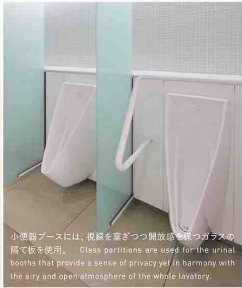
小便器ブースには、視線をきざつつ開放感を保つガラスの隔て板を使用。 Glass partitions are used for the urinal booths that provide a sense of privacy yet in harmony with the airy and open atmosphere of the whole lavatory.