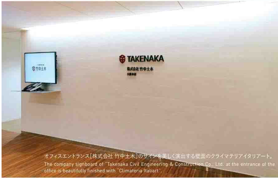
オフィスエントランス[株式会社 竹中土木]のサインを美しく演出する壁面のクライマテリアイタリアート。 The company signboard of "Takenaka Civil Engineering & Construction Co., Ltd. at the entrance of the office is beautifully finished with "Climateria Italiart".