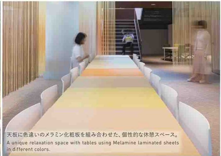
天板に色違いのメラミン化粧板を組み合わせた、個性的な休憩スペース。 A unique relaxation space with tables using Melamine laminated sheets in different colors.