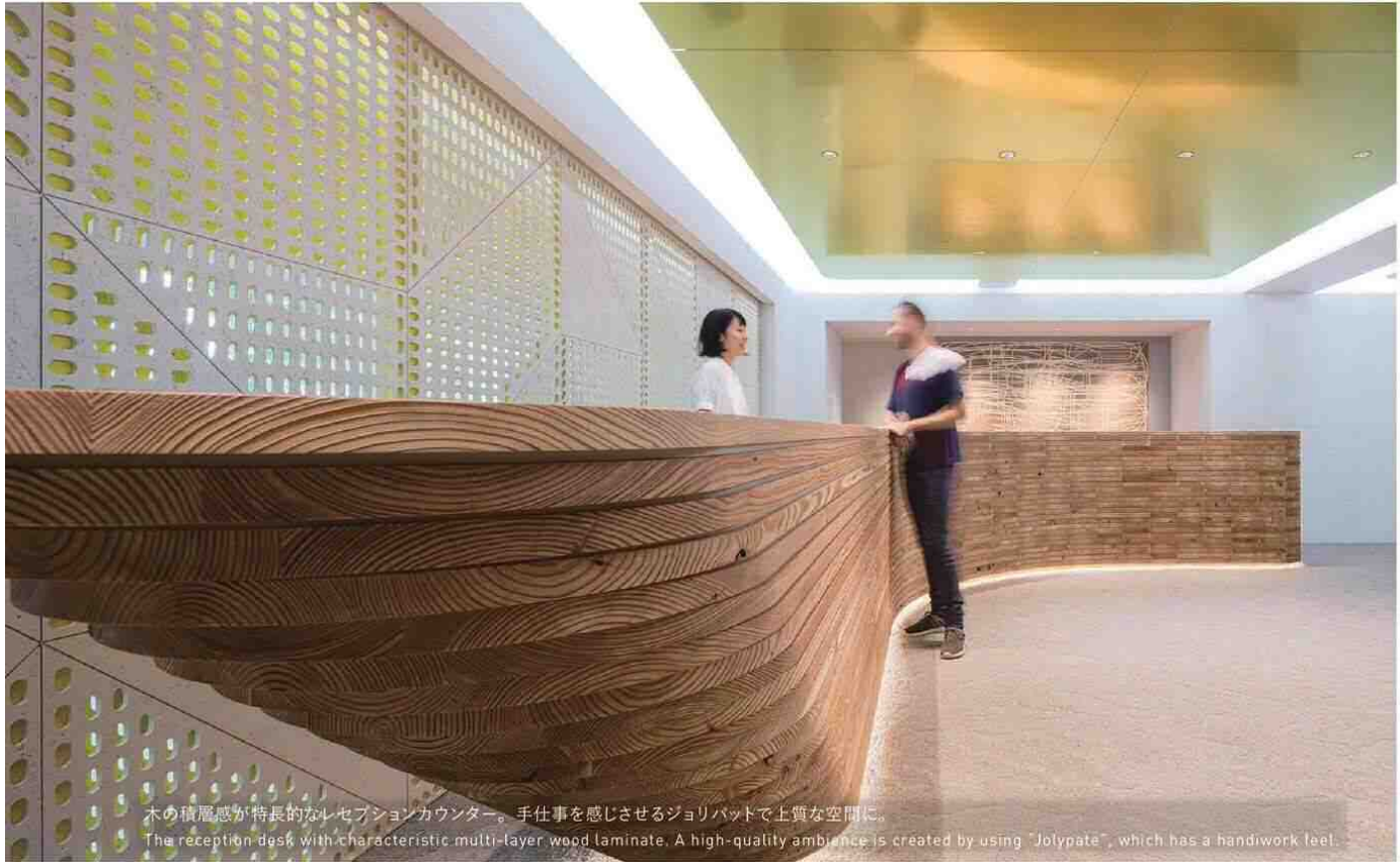
木の積層感が特長的なレセプションカウンター。手仕事を感じさせるジョリパットで上質な空間に。 The reception desk with characteristic multi-layer wood laminate. A high-quality ambience is created by using "Jolypate", which has a handiwork feel.