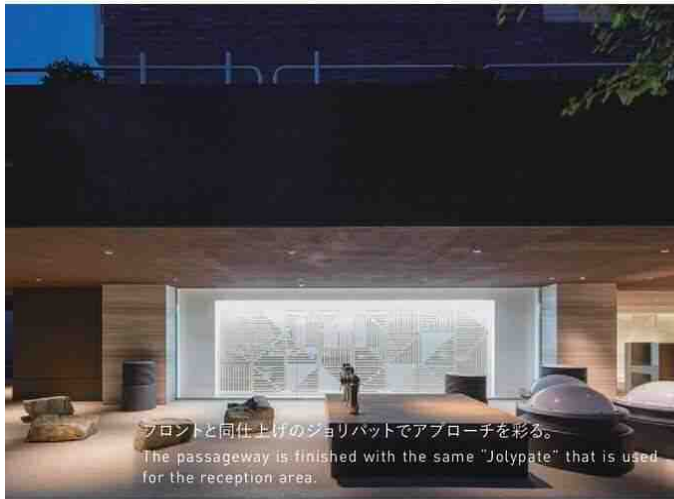
フロントと同仕上げのジョリパットでアプローチを彩る。 The passageway is finished with the same "Jolypate" that is used for the reception area.