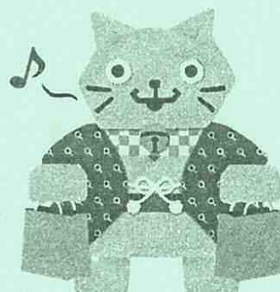
プレミアム付商品券キャラクター「カクニヤン」

問い合わせ先 岡崎市プレミアム付商品券事業コールセンター （事業受託者 （株）近畿日本ツーリスト中部） TEL 052-386-9010