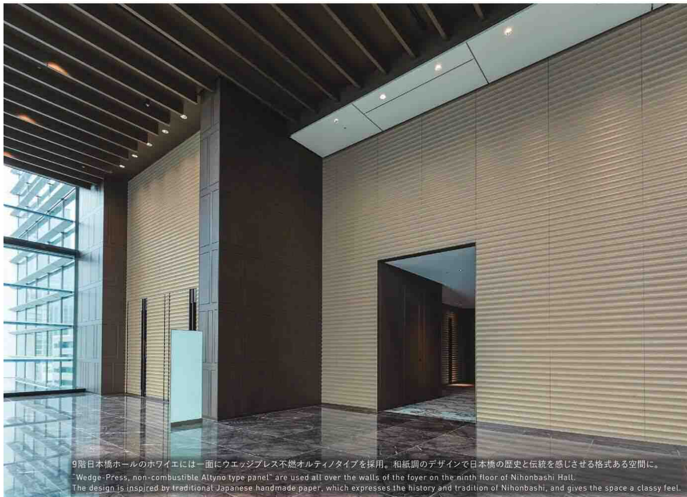
9階日本橋ホールのホワイエには一面にウエッジプレス不燃オルティノタイプを採用。和紙調のデザインで日本橋の歴史と伝統を感じさせる格式ある空間に。 "Wedge-Press, non-combustible Altyno type panel" are used all over the walls of the foyer on the ninth floor of Nihonbashi Hall. The design is inspired by traditional Japanese handmade paper, which expresses the history and tradition of Nihonbashi, and gives the space a classy feel.