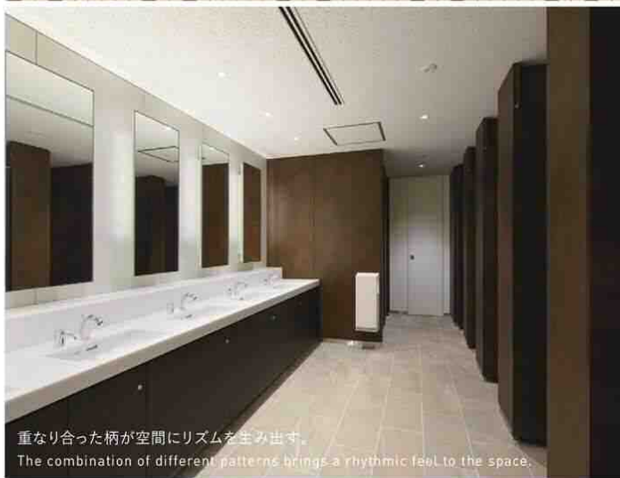
重なり合った柄が空間にリズムを主み出す。 The combination of different patterns brings a rhythmic feel to the space.

高級感のあるラウンジ空間のバーカウンターに耐久性の高いメラミン化粧板を採用。 Durable Melamine laminated sheets are used for the bar counter in this luxurious lounge.