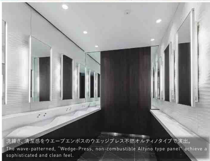
洗練さ、清潔感をウエーブエンボスのウエッジプレス不燃オルティノタイプで演出。 The wave-patterned, "Wedge-Press, non-combustible Altyno type panel" achieve a sophisticated and clean feel.